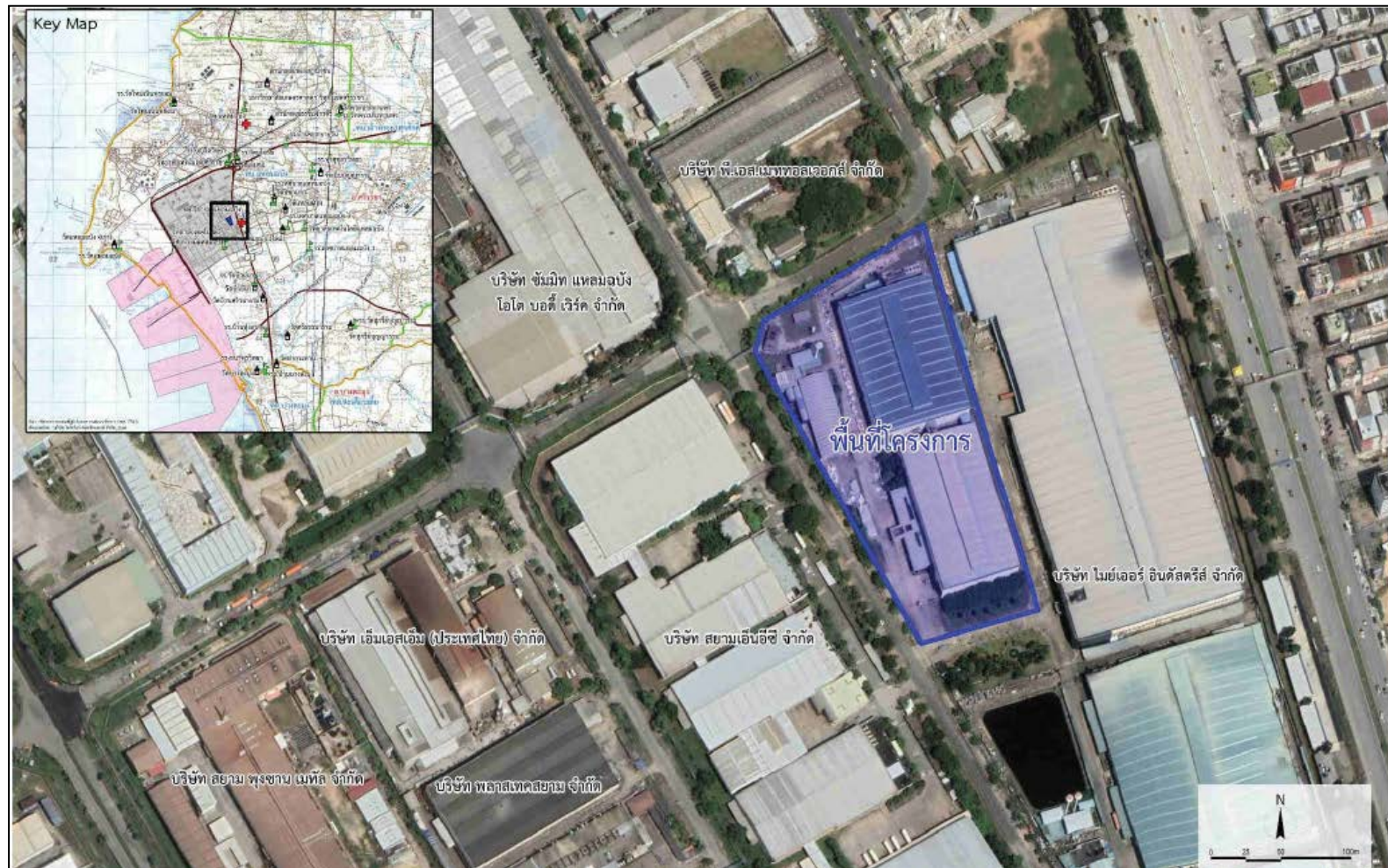
ภาพที่ 1.1 แผนที่แสดงที่ตั้งโครงการ